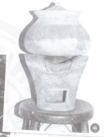
□ ๑ เตาอังโล่ของจีน เชื้อเพลิงคือถ่าน □ ๒ เตาเซิงกรานของไทย เชื้อเพลิงคือฟืน

บ้านเมืองเราแต่ก่อนหาได้อุดมสมบูรณ์อย่างเดี๋ยวนี้ไม่. ที่นับว่าเจริญที่สุดคือในวัง ก็ยังต้องใช้โคมจุดลูกเพื่อแสงสว่าง (จงไปแหงนดูเพดานพระที่นั่งพุทไธสวรรย์ (วังหน้า) ว่าเป็นอย่างไร).