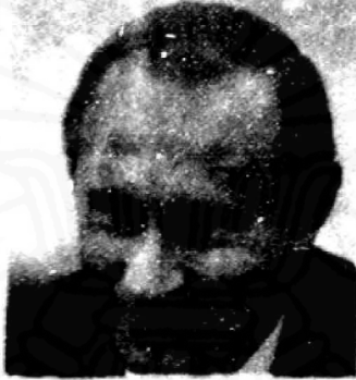
วลาดิมีร์ ปูติน