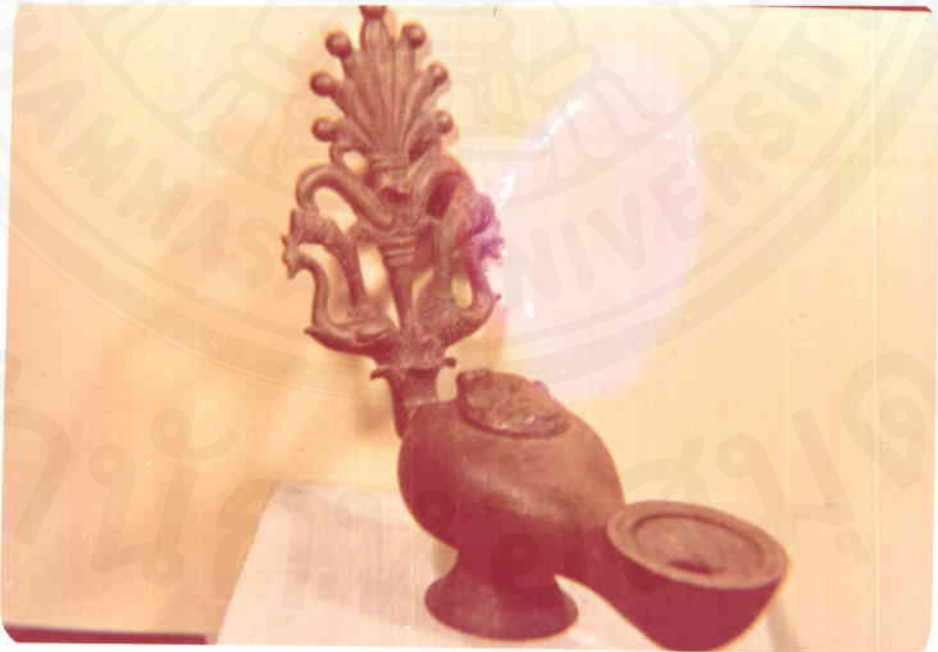
ตะเกียงโบราณ บริเวณท่ามลพชั้ก อำเภอท่ามะกา จังหวัดกาญจนบุรี ได้พบกะเกียงโรมัน