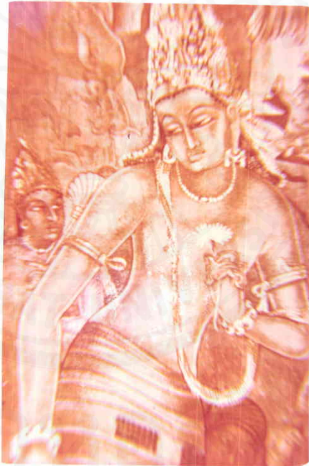
พระโพธิสัตว์อวโลกิเตศวร จิตรกรรมฝาผนังในถ้ำอาชันตา ประเทศอินเดีย ศิลปะแบบคุปตะ

ศิลปะกรรมสมัยทวารวดีที่ขุดพบได้จากตำบลพงตึก จังหวัดกาญจนบุรี อุทอง จังหวัดสุพรรณบุรี ตำบลคูบัว จังหวัดราชบุรี และในจังหวัดนครปฐมนั้น สันนิษฐานว่าได้รับอิทธิพลมาจากอินเดียตอนใต้ ในสมัยราชวงศ์คุปตะหรือว่าได้รับอิทธิพลจากลังกา ซึ่งมีเมืองอนุราชปุระเป็นเมืองหลวง ตามแบบอย่างจิตรกรรมฝาผนังในถ้ำอาชันตา ประเทศอินเดีย ซึ่งทั้งลังกาและทวารวดีอาจต่างฝ่ายต่างได้รับอิทธิพลจากอินเดียตอนใต้โดยตรง ส่วนมากเป็นรูปปั้นพระพุทธรูป ส่วนรูปปั้นคนแคระ คนเตี้ยและรูปสัตว์ต่าง ๆ นั้น มีลักษณะเป็นศิลปะที่คล้ายกับของลังกา