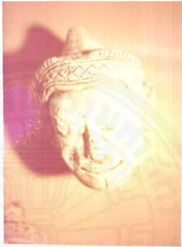
เศียรเทวคาทรงมงกุฎอย่างสันแบบสมัยลพบุรีที่เรียกว่าทรง "จีโบ"