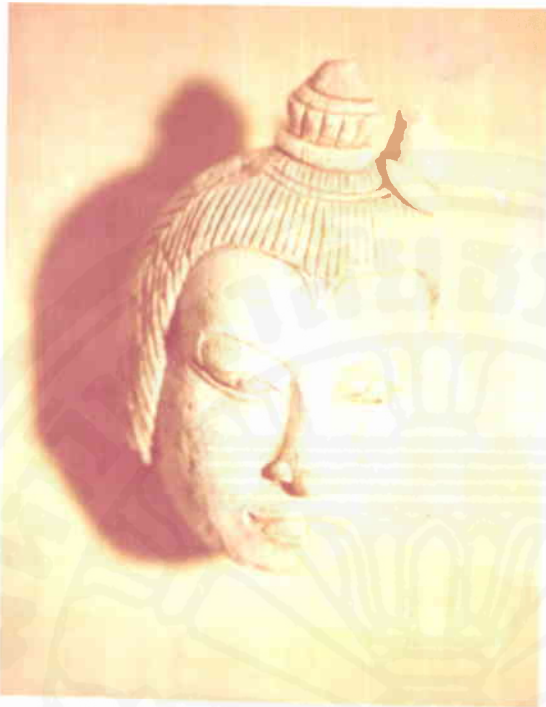
ภาพบุคคลปูนปั้นไว้ผมเป็นจุก ๓ จุก หักขำรุก ๑ จุก เหลือเพียง ๒ จุก