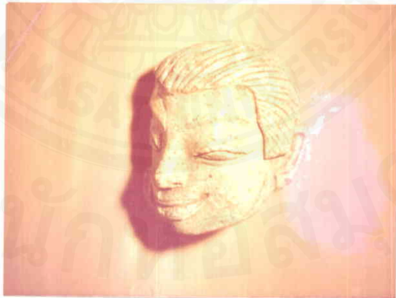
ภาพปูนปั้นหน้าผู้ชาย เป็นศิลปะสมัยอุทองโบหน้าผู้ชายไว้ผมสั้นแบบธรรมดา