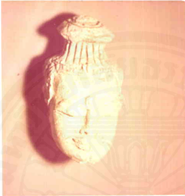
เศียรเทวคาเกคาณมสูง ทำเสนम्मเป็นริ้ว แสดงถึงลักษณะของศิลปะแบบอุทอง อย่างแท้จริง