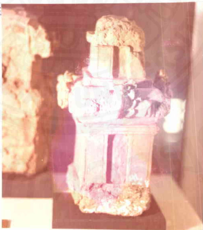
สลุปล้างทองดินเผา ไ้มาจากวัดพระงาม จังหวัดนครปฐม เป็นศิลปะสมัย