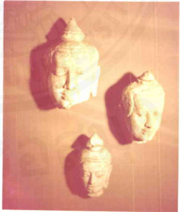
เศียรพระพุทธรูปแบบอุทอง ทำพระเนาคีเป็นตอมแหลม แสดงให้เห็นถึง อิทธิพลของศิลปะสมัยทวารวดีตอนปลาย ลักษณะที่ให้อิทธิพลแบบนี้ เช่น พระพุทธรูปในชุมชน "จรรยา" ที่เจดีย์วัดกุฎีดง จังหวัดลำพูน