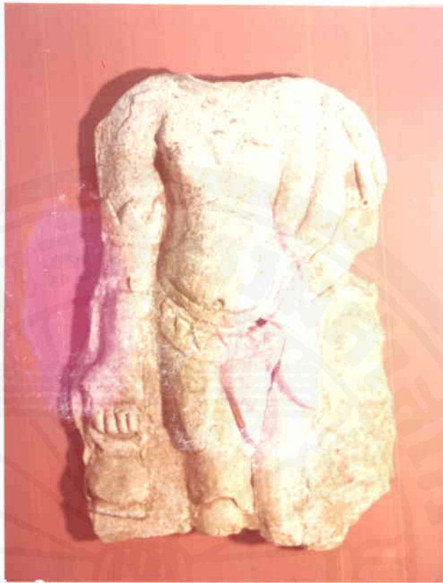
พระโพธิสัตว์อวโลกิเตศวร พระหัตถ์ขวาถือน้ำเต้า พระหัตถ์ซ้ายอาจจะ