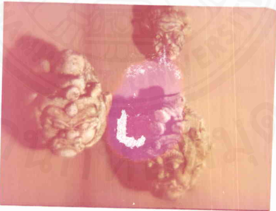
เศียรอสูร เป็นศิลปะแบบอู่ทองมีลักษณะที่ไม่ประณีตคล้ายมากเหมือนกับ ภาพยักษ์หรืออสูรของสมัยอยุธยาที่วัดรัตนโกสินทร์