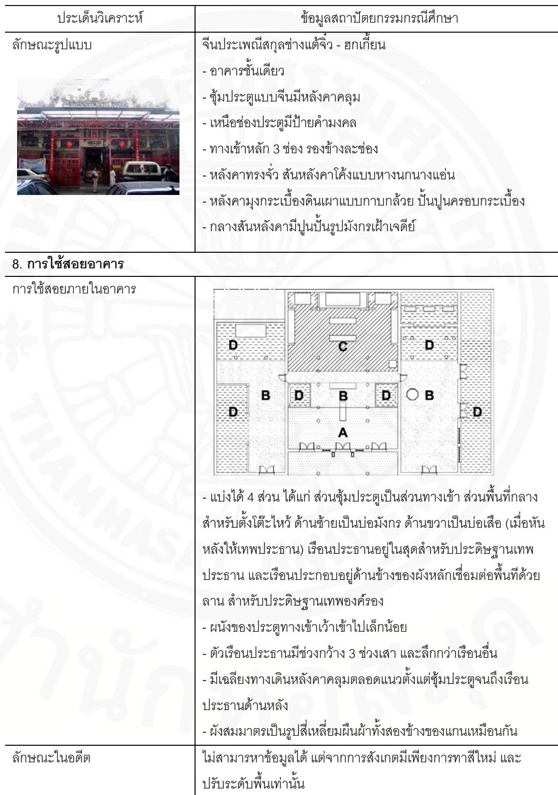
ตารางที่ ๑.1 (ต่อ)