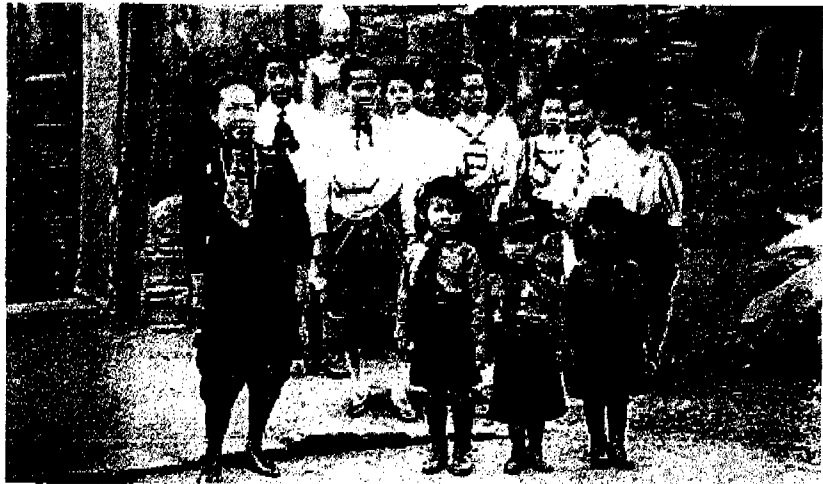
ภาพที่ 25: สมเด็จพระพันปีหลวงเสด็จประพาสปราสาทหินพิมาย