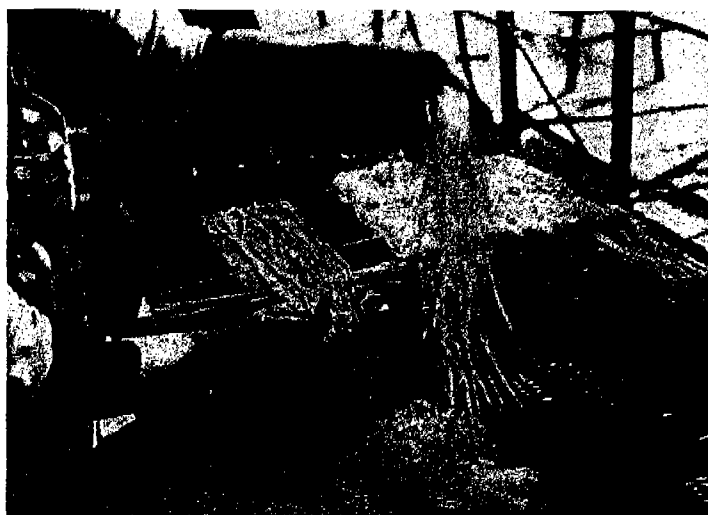
ภาพที่ 28 : มัดหมี่