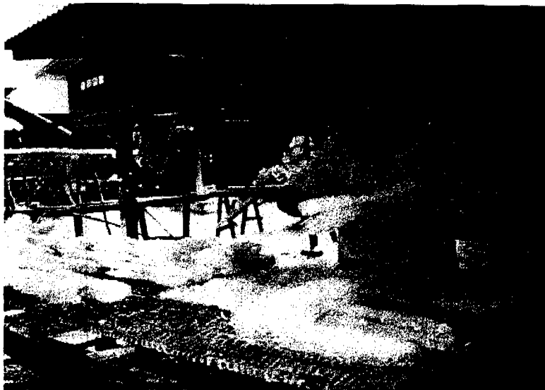
ภาพที่ 29 : ตากหมี่