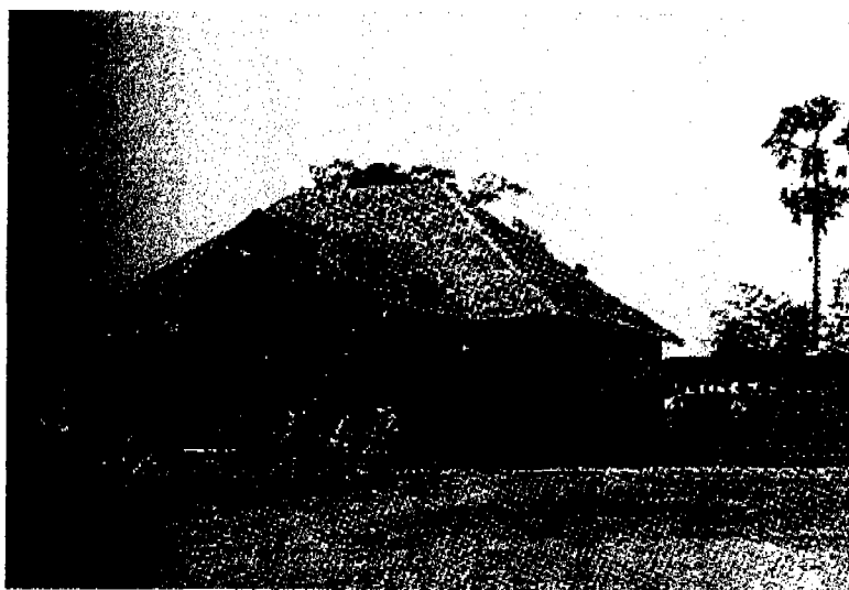
ภาพที่ 24: พลับพลาประทับแรมที่ทางอำเภอได้จัดถวาย

พิมายถูกถือว่าเป็นสถานที่ท่องเที่ยวที่สำคัญมาตั้งแต่สมัยรัชกาลที่ 5 ดังจะเห็นได้จากบันทึกของพระยาพรหมมาภิบาลเมื่อครั้งออกไปตรวจราชการมณฑลนครราชสีมาว่า “ที่เมืองพิมายมีเทวสถานของโบราณทำด้วยฝีมืออันปราณีตเป็นที่เลื่องลือมีผู้ไปเที่ยวชมเนือง ๆ” (พระยาพรหมมาภิบาล 2440) และการที่สมเด็จพระบรมราชชนนี พระพันปีหลวง (สมเด็จพระนางเจ้าเสาวภาผ่องศรี พระบรมราชินีในรัชกาลที่ 5) ได้เสด็จพระราชพระราชดำเนินประพาสมณฑลนครราชสีมา ในปี พ.ศ. 2454 ได้แวะเที่ยวชมปราสาทหินและโบราณวัตถุที่พิมาย โดยมีสมเด็จพระเจ้าสว่างวัฒนา พระราชมาตุจฉา ในรัชกาลที่ 8 -9 และสมเด็จพระเจ้าน้องยาเธอในรัชกาลที่ 6 กรมหลวงเพชรบุรีราชสิรินธร พระเจ้าลูกยาเธอเจ้าฟ้าหญิงในสมเด็จพระนางเจ้าสว่างวัฒนา (หมวก ไชโย 2507) ประทับแรมที่พลับพลาริมลำน้ำตลาด ในบริเวณที่เรียกกันว่า “เนินปราสาท”