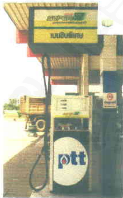
กล่องไฟผลิตภัณฑ์เหนือตู้จ่าย และ สติ๊กเกอร์ติดตู้จ่ายน้ำมัน