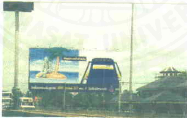
ชุด “ปล่อยเกาะ”