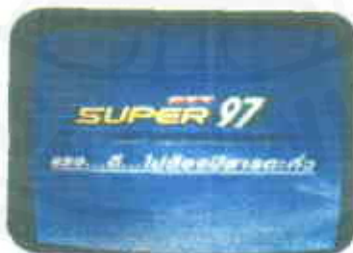
พื้ท้ท้ ซุเปอร์ 97