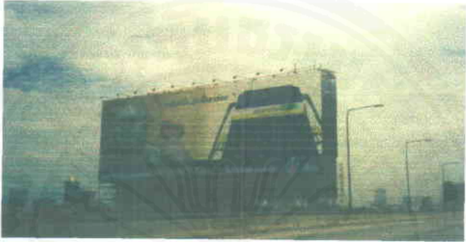
ชุด “ ลาก่อน ”