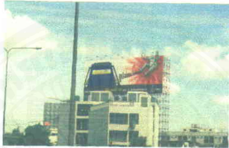
ชุด “ซูเปอร์แรง...ไม่ต้องมีสารตะกั่ว”