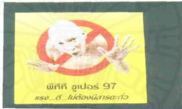
เต็นท์การ์ด