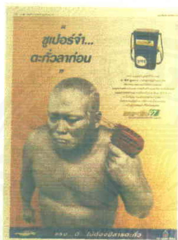
ชุด "ตะกั่วลาก่อน"