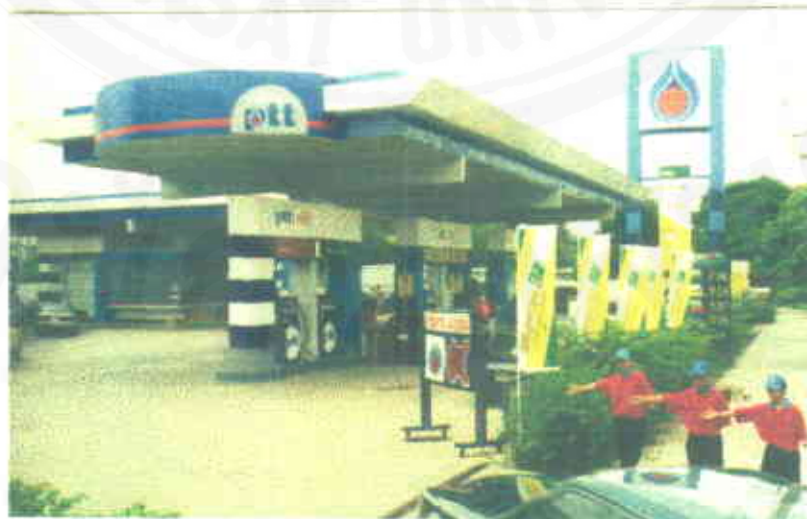
ธงฉิ่งปูน