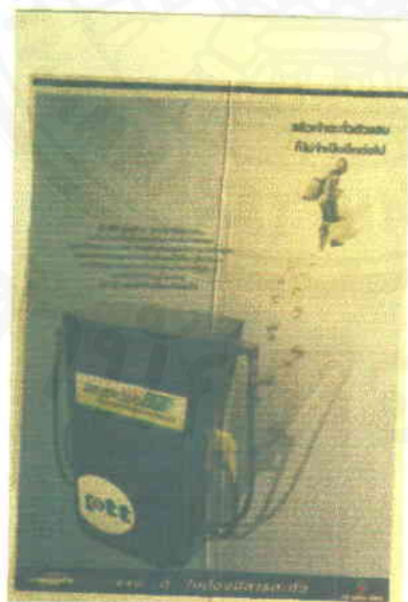
ชุด "ตะกั่วตัวแสบ"