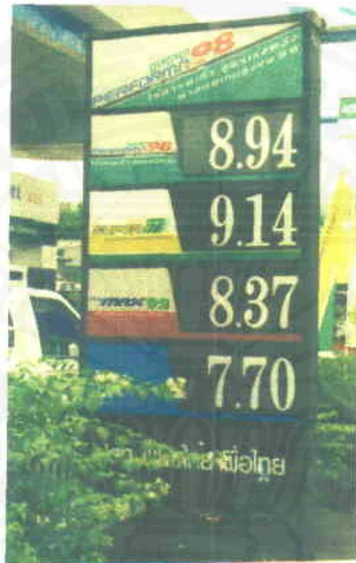
ป้ายบอกราคา