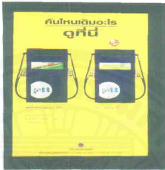
โปสเตอร์