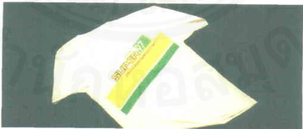
เสื่อซิด