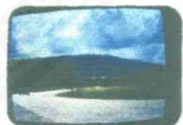
เวรตีไม่ต้อเมือสาคะท้