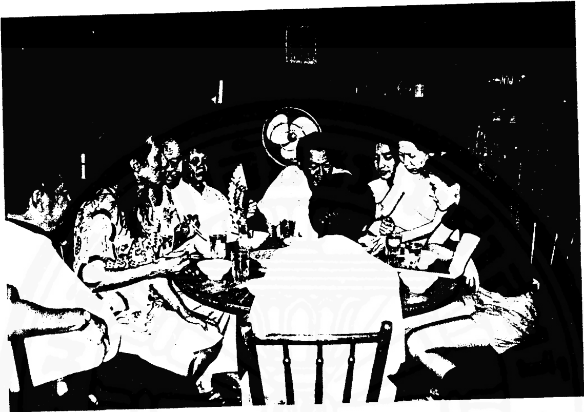
ฉากนี้พี่ตัวละครหลายตัว แต่ตัวละครทุกตัว สามารถนำสังคมเป็นวงกลมโดยไม่มีตัวแสบ ซึ่งวางให้ตัวละครจับภาพโดยการ เคลื่อนกล้องไปตามทางโค้ง (arching)